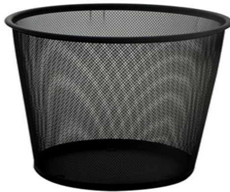
Figura 02: Foto ilustrativa tipo de lixeira a ser usada no escritório e banheiro.