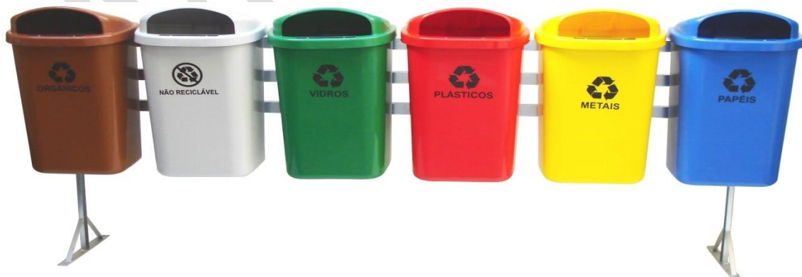
Figura 03: foto ilustrativa tipo de coletores a ser implantado na aérea de lavagem.

Nas áreas de lavagem e de aspiração/finalização, onde terão os rejeitos de garrafas pet, papeis vidros entre outros. Devem ser colocados coletores de 50 litros conforme a (fig. 03), com sacolas de polietileno separadas pelos códigos de cores, seguindo a orientação da Resolução CONAMA nº 273, de 29 de novembro de 2000.