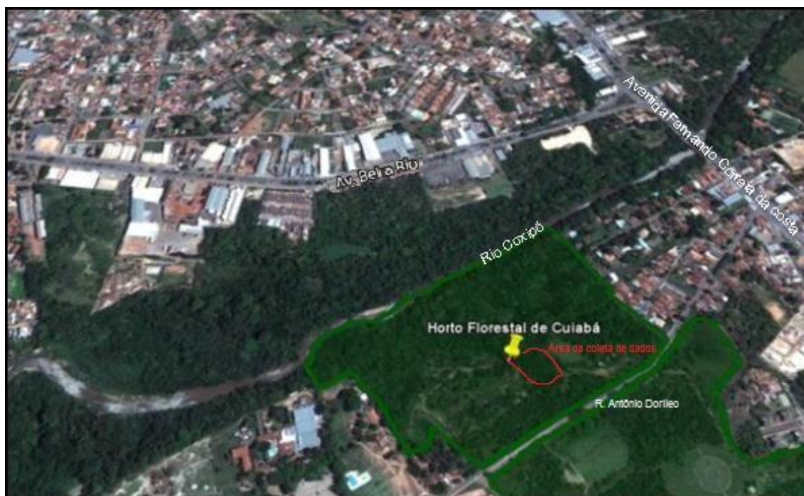
Figura 1. Localização e delimitação do Horto Florestal Tote Garcia, Cuiabá-MT