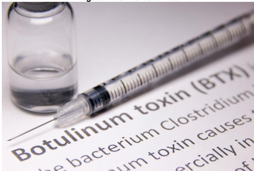
Figura 1- toxina botulínica

Ginecologia e Ortopedia, que podem resolver disfunções e melhorar a qualidade de vida de pacientes (BARBOSA et al., 2017; SPOSITO, 2009).