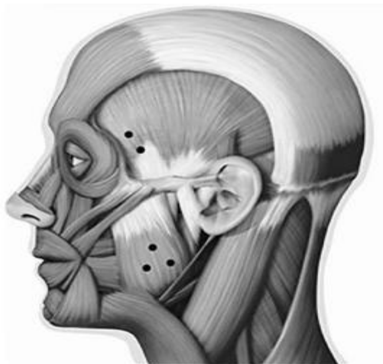
Figura 2. Algumas localizações da aplicação de toxina botulínica relacionados com a terapêutica do bruxismo